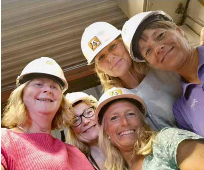
Landsstyrets sommermøte i Hattfjelldal