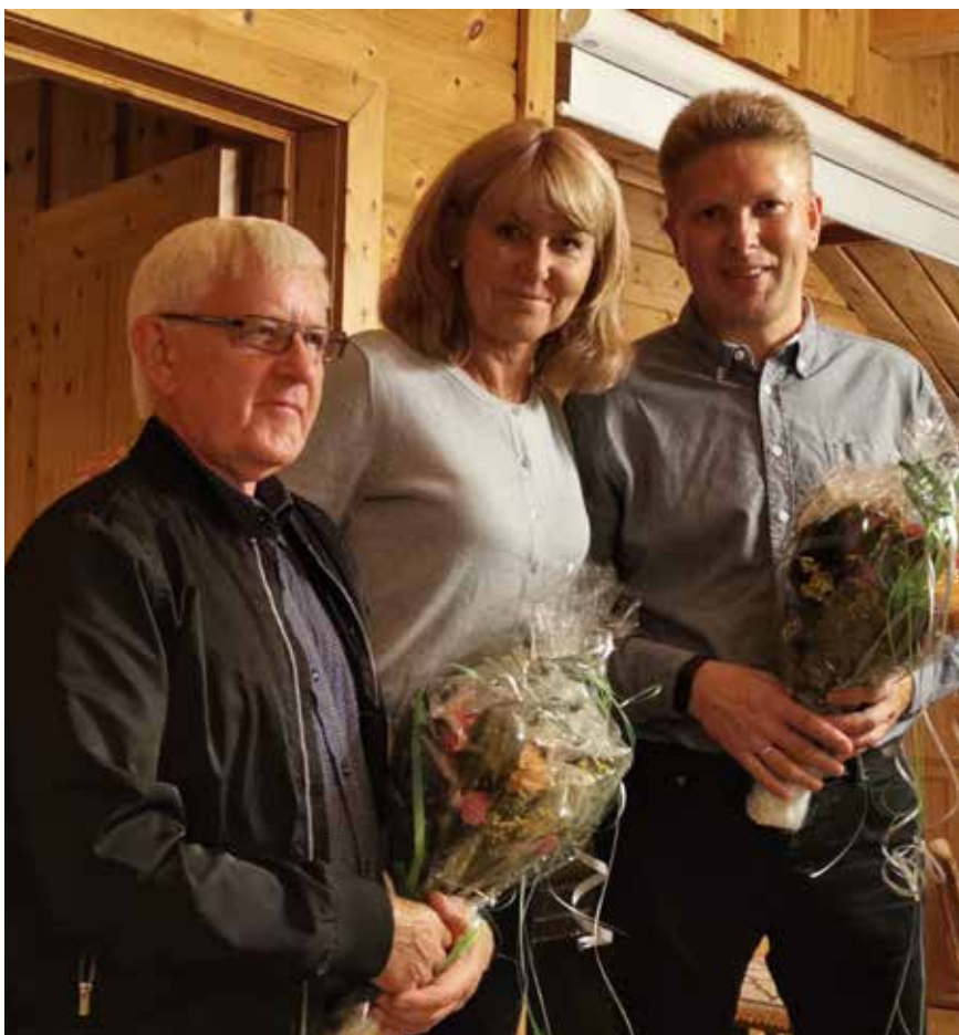
Landsstyrets sommermøte i Hattfjelldal