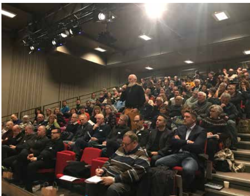
Stinn brakke og oppheita stemning på folkemøte i Valldal om tap av bufe pga av jerven

USS har i 2019 arbeidet for å starte et forskningsprosjekt om dokumentasjon av ulvesonens samlede virkninger for lokalsamfunnene som den omfatter. Prosjektet vil kunne ha betydning for anvendelsen av naturmangfoldloven § 18 første ledd bokstav c. USS mener at kommuner