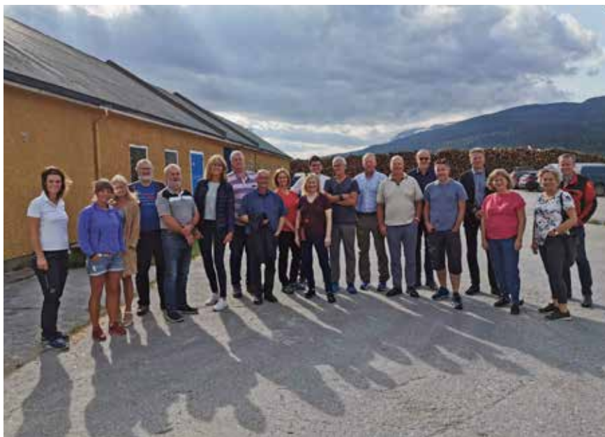
Landsstyrets sommermøte i Hattfjelldal

Videre er det gitt høringsuttalelse til kraftskatteutvalgets rapport og til en rekke representasjonsforslag, blant annet forslag om å ta bedre vare på naturmangfold og viktig norsk natur (Dok 8:151 S (2018-2019)).